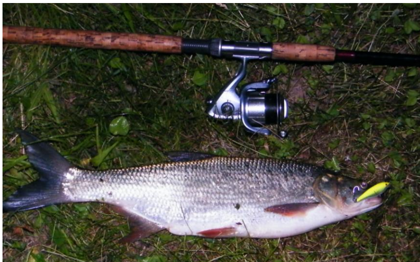
A „pelyhes balin”

veket, és folyóink talán visszakaphatják azt a „személyiségüket” - mint ökológiai állapotot - ami valóban jellemző rájuk, és ezáltal mind a természet, mind pedig a becsületes horgászok érdekeit kiszolgálhatják.